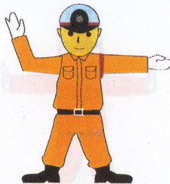
ห้ามรถทางด้านหน้าและด้านหลัง

76. ถาม เมื่อพนักงานเจ้าหน้าที่ยื่น และยกแขนขวาท่อนล่างตั้งฉาก กับแขนท่อนบน และตั้งฝ่ามือขึ้น ส่วนแขนซ้ายเหยียดออกไปเสมอระดับไหล่ หมายความว่าอย่างไร